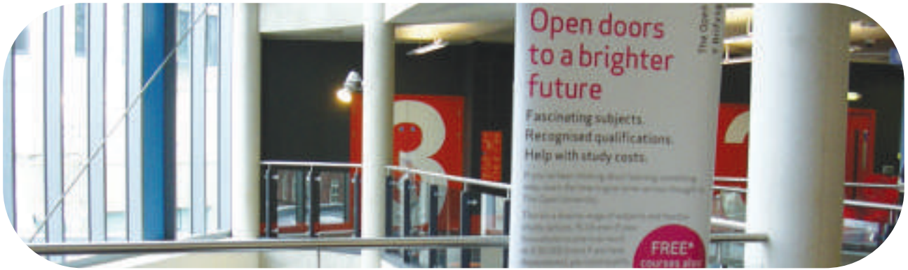
Digwyddiad y Brifysgol Agored yn Llyfrgell Ganolog Caerdydd