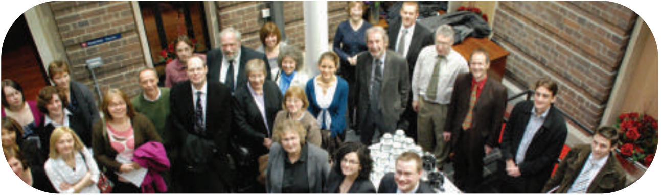
Mynychwyr yn y lansiad