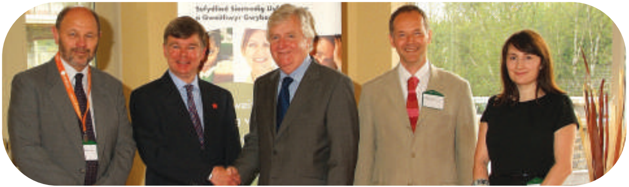
Alun Ffred Jones, y Gweinidog Treftadaeth, yn cwrdd â mynychwyr yng Nghynhadledd Llyfrgelloedd Cymru