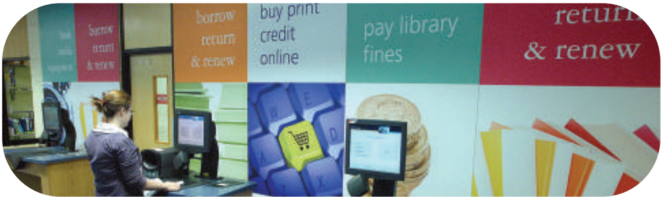
Canolfan Adnoddau Dysgu Trefforest, Prifysgol Morgannwg