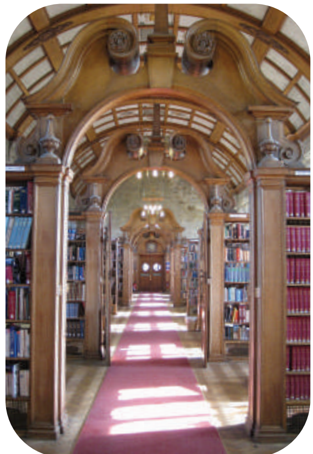
Ystafell Ddarllen Shankland, Llyfrgell Prifysgol Bangor