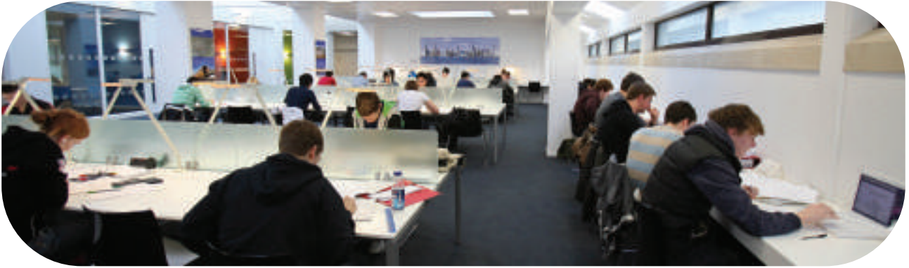
Llyfrgell Trevithick, Prifysgol Caerdydd