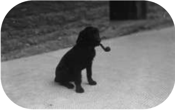
Ci â phibell yn ei geg