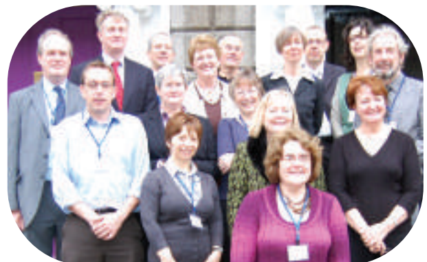
Mynychwyr cyfarfod COLICO

Crewyd cysylltiadau â CONUL, consortiwm o brif lyfrgelloedd ymchwil Iwerddon, ac mae'r meysydd posibl ar gyfer gweithredu ar y cyd yn cynnwys ymweliadau dwy-ffordd, datblygu staff, llythrennedd gwybodaeth a phrosiectau digideiddio. Mynychodd y grŵp hefyd gyfarfod o COLICO, corff Gogledd-De sy'n annog prosiectau cydweithredol yn Iwerddon (gweler y llun).