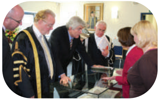
Rhodri Morgan, Prif Weinidog Cymru, yn gweld Beibl Llanbedr Pont Steffan 1279 yn ystod agoriad swyddogol Llyfrgell Roderic Bowen