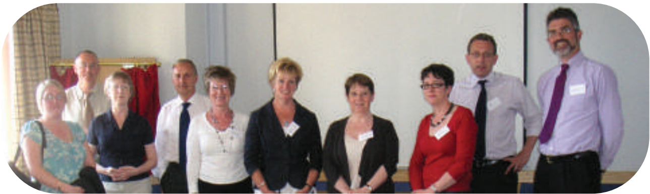
Mynychwyr y cyfarfod gyda SCURL