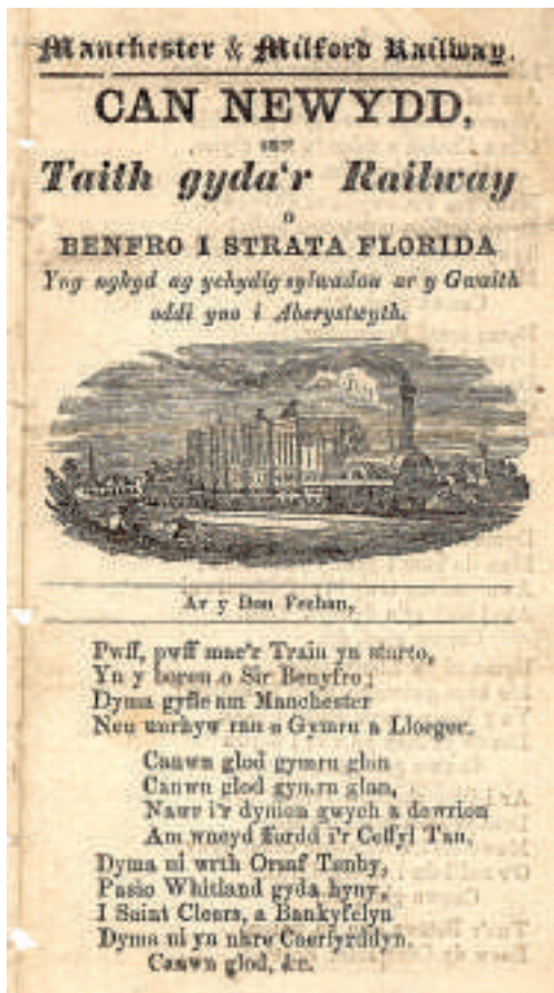
Baled wedi'i digideiddio o'r casgliad yn Llyfrgell Salisbury, Prifysgol Caerdydd

Bydd prosiect y Baledi Cymreig yn llenwi'r bwlch olaf yn y rhwydwaith o gasgliadau digidol o faledi printiedig trwy Brydain benbaladr. Ym Mrifysgol Caerdydd, ynghyd â Llyfrgell Genedlaethol Cymru a llyfrgelloedd Prifysgolion Bangor a Llambled, y mae'r prif gasgliadau o faledi Cymreig printiedig (yn Gymraeg a Saesneg). Caiff cyfanswm o 5,000 o faledi eu digideiddio, o'r baledi cynharaf o'r 18fed ganrif, hyd at yr ychydig olaf a gyhoeddwyd yn yr 20fed ganrif. Bydd hyn yn cynhyrchu cyfanswm o ryw 20,000 o dudalennau o ddelweddau testun digidol (y cyfan allan o hawlfraint). Datblygir porthol gwefan o gynllun peilot sydd eisoes mewn bodolaeth yng Nghaerdydd. Bydd hyn yn darparu porth ac adnodd academiaidd i hwyluso mynediad ac astudiaeth o'r faled yng Nghymru, ym Mhrydain ac yn y cyd-destun rhyngwladol, a bydd yn cysylltu â'r catalog a'r delweddau baled.