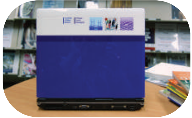
Gliniadur ar fenthyg yng Nghasnewydd