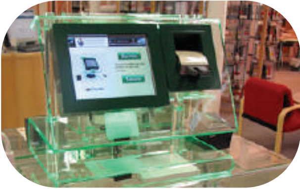
RFID yng Ngholeg y Drindod