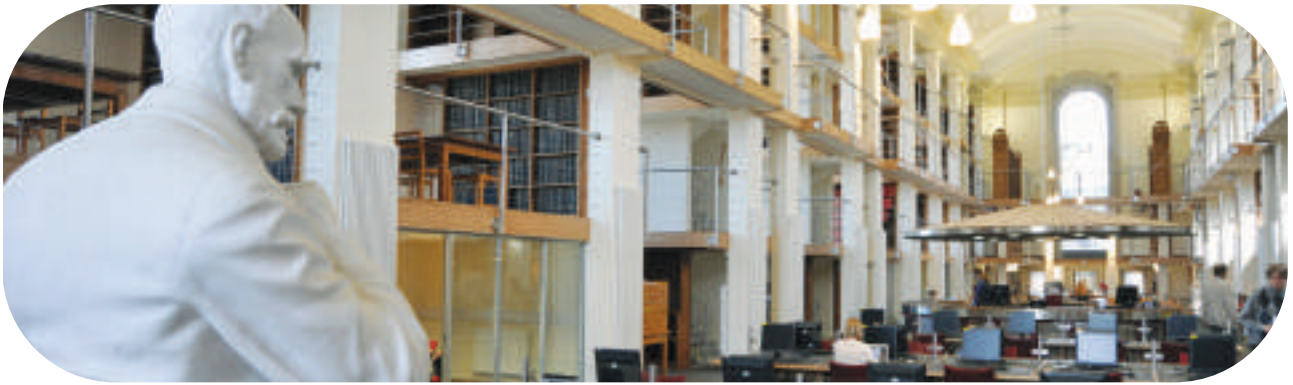
Ystafell Ddarllen y Gogledd, Llyfrgell Genedlaethol Cymru